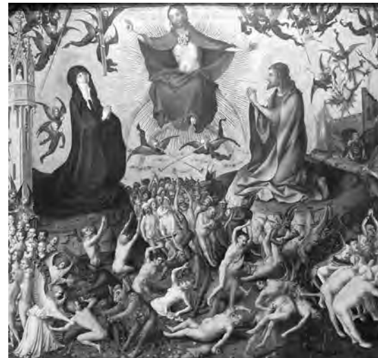
Stefan Lochner, Weltgericht mit Seligen und Verdammten (Köln, Wallraf-Richartz-Museum)

ce auf Rettung habe, dann habe er auch keine Chance. Im November gedenken wir der Verstorbenen und bedenken, dass auch wir sterblich sind. Der Wochenspruch