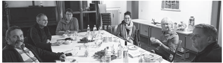
Weihnachtssitzung unseres Kirchenvorstandes

Veränderungen auf allen Ebenen werden immer mehr Realität. Große Aufgaben kommen auf unsere Kir-